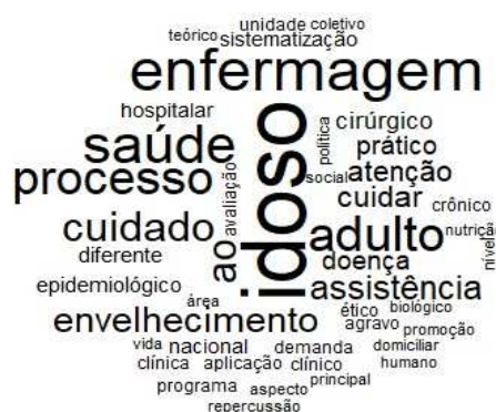
Figura 1 – Nuvem de palavras

A nuvem de palavras, representada pela figura 1, foi gerada a partir da análise do corpus das 20 ementas disponíveis. Nesta, os termos mais citados foram: idoso (n= 35); enfermagem (n= 23); saúde (n= 21) e; adulto (n= 19).